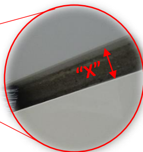
Figura 2 – Largura da abertura varia conforme o modelo do filete