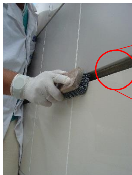
Figura 1 – Espaço reservado para assentamento do filete

1° Passo - Realizar o assentamento do revestimento cerâmico, deixando espaço destinado ao filete metálico, conforme Tabela 1; Para maiores informações sobre assentamento dos revestimentos cerâmicos, acesse o Manual de Instalação em http://especificadorvirtual.portobello.com.br/area_tecnica .